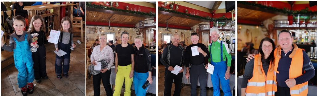
Auf zahlreiche Teilnahme und einen unfallfreien Tag hofft der ASKÖ – ESV-SALZBURG

Siegerehrung: findet um ca. 14.00 Uhr im Restaurant Cafe-Rodelalm, Flachau. Es werden schöne Preise für Kinder, Erwachsene und Teams vergeben.