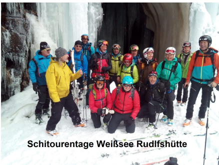
Schitourentage Weißsee Rudolfshütte

Somit wünschen wir einen unfallfreien Winter für die Saison 2018/2019.