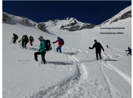
Tourentage Rudolfshütte Granatspitzkees 2800m

Wie jedes Jahr beginnen wir im Vorwinter mit leichteren Touren und steigern uns dann im Laufe des Winters auf längere und anspruchsvollere Anstiege und Abfahrten.